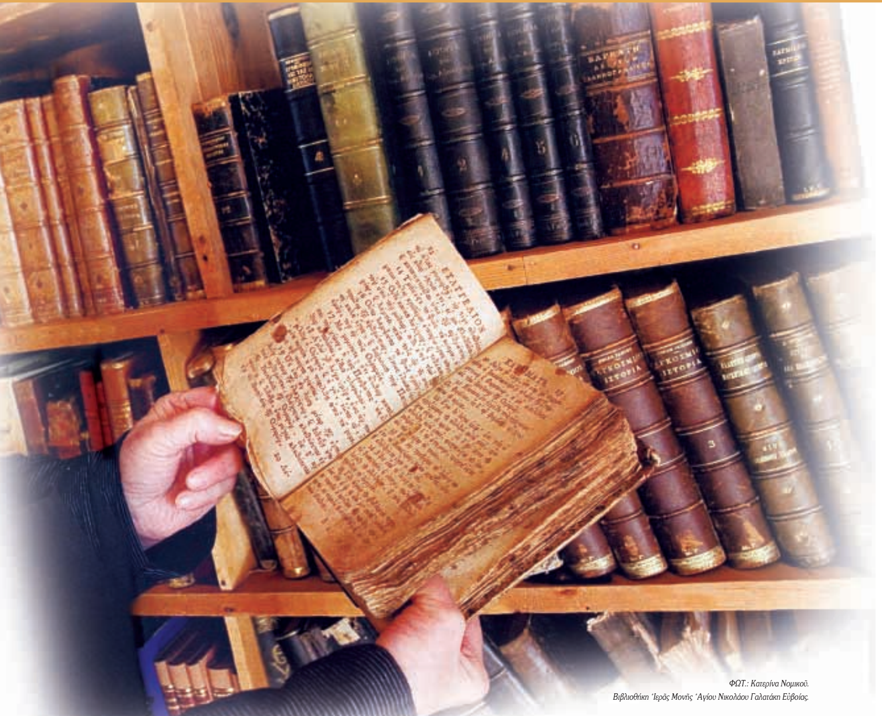
ΦΩΤ.: Κατερίνα Νομικού. Βιβλιοθήκη Ἱερᾶς Μονῆς Ἁγίου Νικολάου Γαλατάκη Εὐβοίας

Κοσμᾶ στόχο ἔχει νά παιδαγωγῆσει ἐν Χριστῷ τόν ἄνθρωπο. Ὅσοι ἐπικαλοῦνται τόν πατροΚοσμᾶ δέν πρέπει αὐτό τό λεπτό σημεῖο νά τό ἀποκρύπτουν ἀπό τό κήρυγμά του.